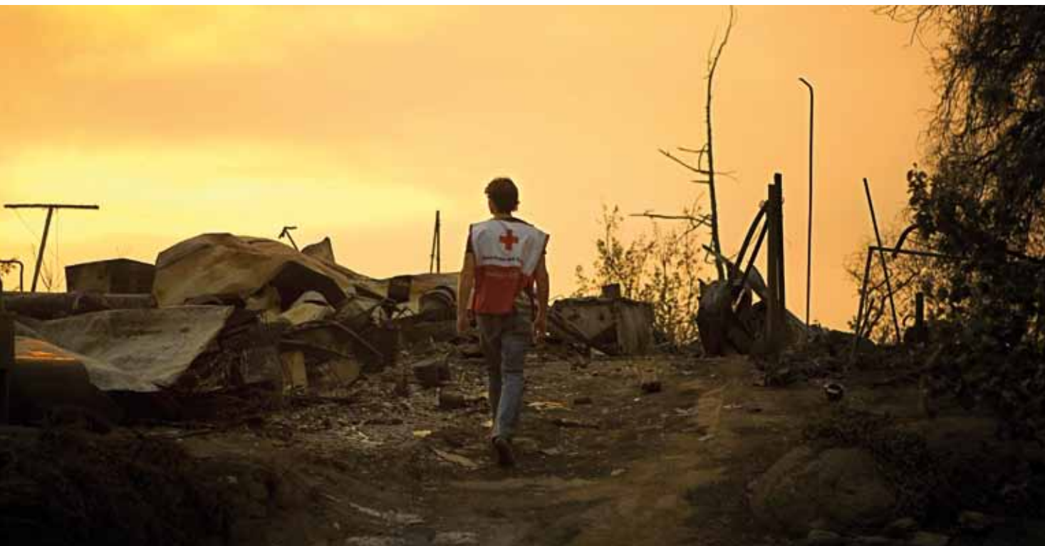
Un voluntario de la Cruz Roja Americana observa el corolario de destrucción tras el incendio en Harris que arrasó cerca de 75.000 acres en esa zona suroriental del condado de San Diego.

Internacional de la Cruz Roja. “La búsqueda y rescate de personas en una estructura derrumbada exige que se ingrese en ese edificio y, como socorrista, se corre el mismo peligro que los demás. Cuando se recoge a los heridos en un campo de batalla, aunque se use un chaleco distintivo de la Cruz Roja, una bala perdida no reconoce a los integrantes de la Cruz Roja”. También recuerda un intento de rescate, a cargo de voluntarios mal capacitados, que no formaban parte de la Cruz Roja, durante una fuerte inundación en Filipinas. Si hubieran recibido la formación adecuada, habrían sabido que no se debe usar un bote de goma en las aguas turbulentas de la inundación. Sin embargo, salieron en una embarcación de ese tipo que volteó y no hubo supervivientes.