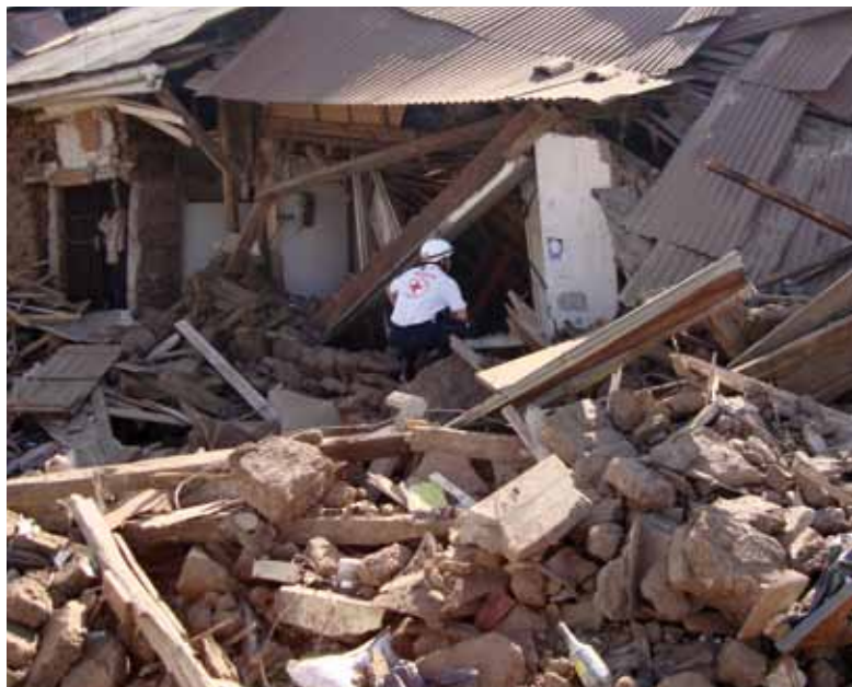
Tras el devastador terremoto ocurrido el 28 de febrero de 2010, los voluntarios de la Cruz Roja Chilena prestaron socorro de emergencia, entre otras, mediante actividades de búsqueda y rescate, evacuación de personas, remoción de escombros y recuperación de cadáveres.

Dos de cada mil personas en el mundo prestan servicios voluntarios para el Movimiento Internacional de la Cruz Roja y de la Media Luna Roja. El 26% de esos voluntarios participan en la intervención en casos de desastres; entre 2004 y 2010, los voluntarios prestaron asistencia a 300 millones de personas. Los voluntarios llevan a cabo una gama de actividades y se enfrentan también a un sinnúmero de riesgos. Las estadísticas detalladas sobre muertes y lesiones de voluntarios son escasas, ya que cada país es responsable de sus propios voluntarios, y no siempre pueden informar de todo lo que sucede sobre el terreno. Los sistemas de presentación de informes a menudo se ven obstaculizados por limitaciones en materia de tecnología o de capacidad. Lo cierto es que en 186 países, los voluntarios de la Cruz Roja y de la Media Luna Roja constituyen constantemente el primer frente de intervención ante las emergencias, ya se trate de tsunamis, guerras civiles, o pandemias.