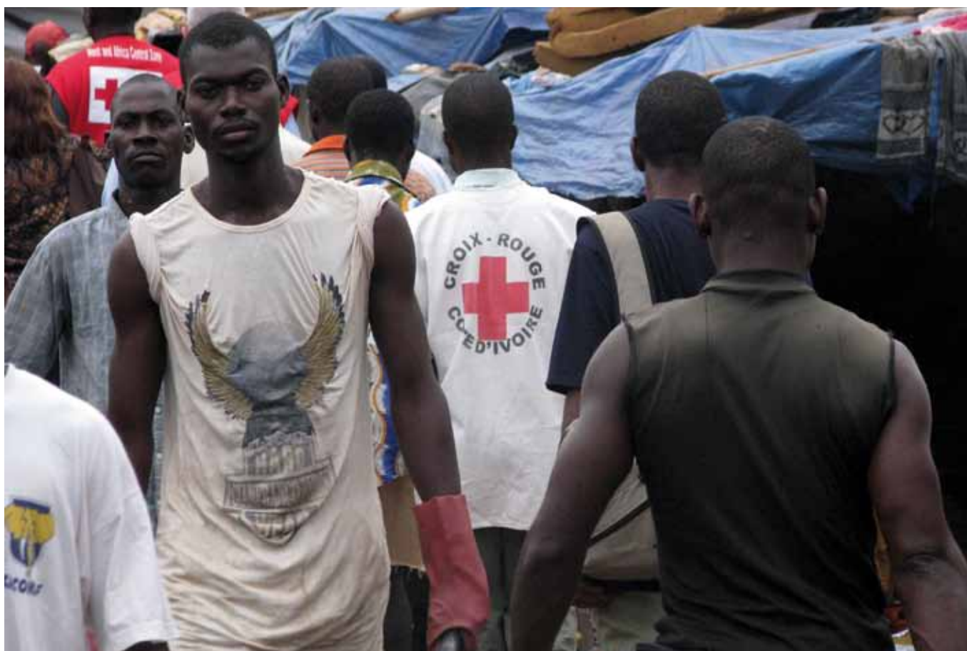
Voluntarios de la Cruz Roja en un recorrido por el campamento para personas desplazadas en Duékoué, en la zona occidental de Côte d'Ivoire, a donde miles de personas huyeron al desencadenarse una ola de violencia a raíz de las elecciones, en diciembre de 2010.

En los últimos años se ha prestado mayor atención a la situación jurídica de los voluntarios en todo el mundo. El Programa de Voluntarios de las Naciones Unidas y la Federación Internacional han publicado nuevos informes sobre esta cuestión. Así, en 2009, el Programa de Voluntarios de las Naciones Unidas publicó un informe sobre las normativas jurídicas y