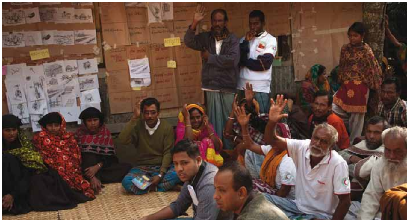
Los voluntarios de la Media Luna Roja de Bangladesh Red aportan instrumentos y herramientas a las comunidades para ayudarlas a mejorar su entorno y les enseñan paso a paso la manera de construir viviendas más seguras.

USD 6.000 millones, o sea casi 90 centavos de dólar estadounidense por cada habitante del planeta.