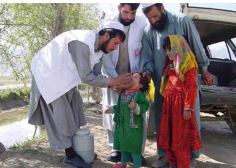
Voluntarios de la Media Luna Roja Afgana participan en una campaña nacional de inmunización contra la poliomielitis.

para buscarlo. “Cuando abrí la puerta -comenta- lo vi tendido y, al levantarle la cabeza, le salía espuma por la boca. Tenía metralla en el pecho y su camisa estaba cubierta de sangre. Rompí a llorar, no podía contenerme.” Al-Awami murió camino al hospital. El joven auxiliar sanitario había sido voluntario en el hospital desde que comenzó el levantamiento y había solicitado formar parte del servicio de ambulancia para prestar asistencia en la línea de frente.