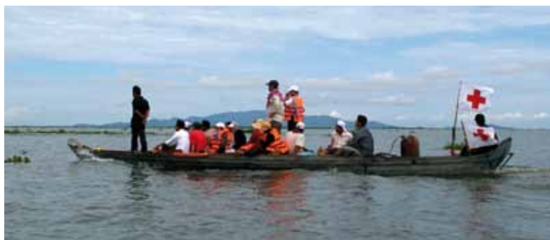
Una brigada de socorro de la Media Luna Roja Camboyana visita la comuna de Cork Trabek, afectada por las inundaciones registradas en la provincia de Kampong Thom, en 2011.