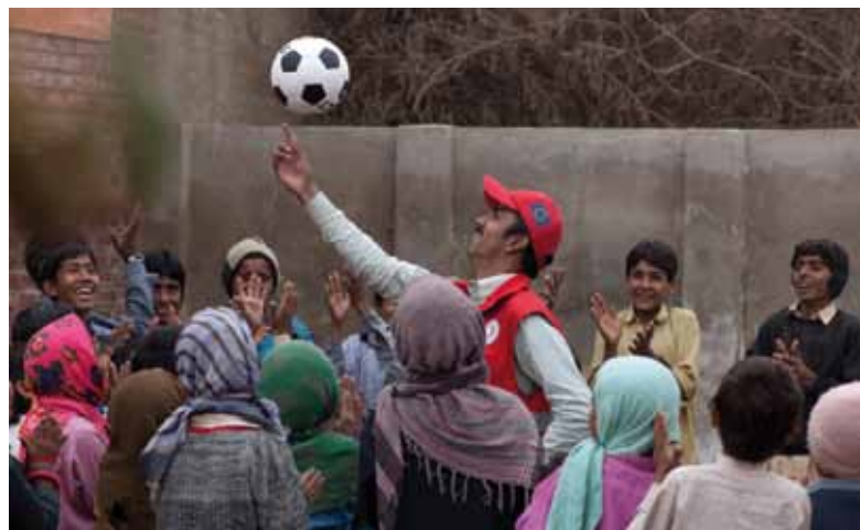
La Cruz Roja Danesa y la Media Luna Roja de Pakistán ejecutan en la provincia de Sindh un proyecto de acompañamiento psicosocial mediante el cual se ayuda a los niños a recuperarse del trauma provocado por las inundaciones.

La señora Akasha organizó sesiones con los voluntarios, en las que se estableció un entendimiento común sobre el orden de los acontecimientos, y