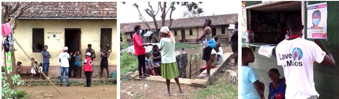
Actividades de sensibilização em Agostinho Neto